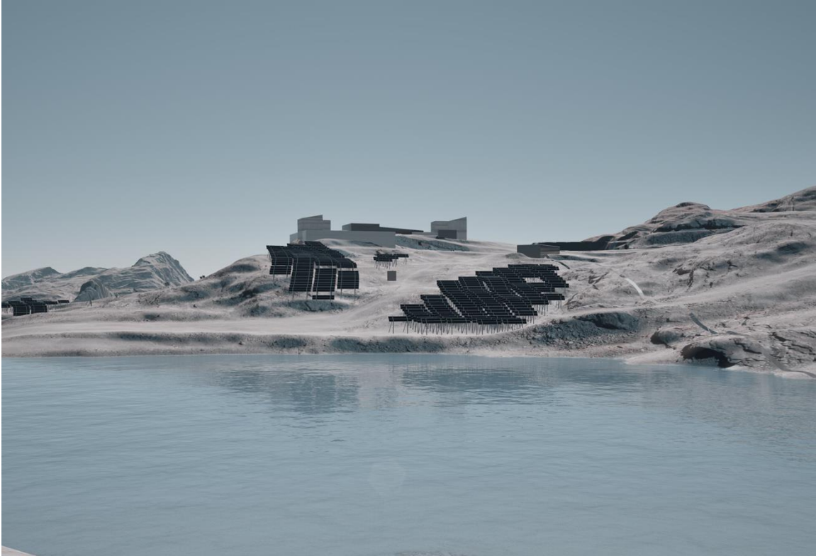
Abbildung 2 Visualisierung Trockener Steg 3 + 4 mit Blick von Theodulsee