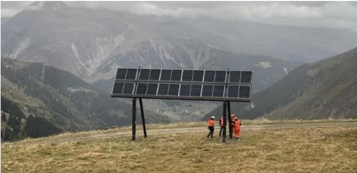
Abbildung 3 Test-Unterkonstruktion für NalpSolar (Sedrun, GR)